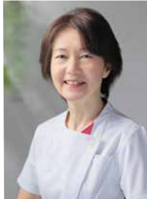
公立松任石川中央病院 看護部長

信頼され質の高い看護が提供できる 看護師を目指して、 共に看護の語りを紡いでみませんか